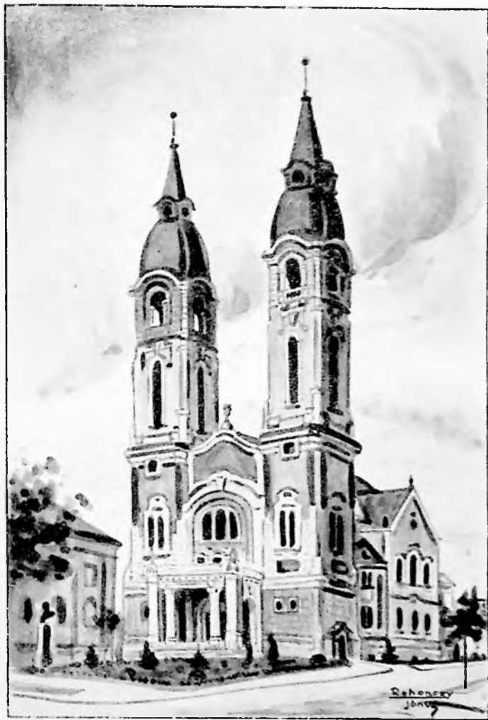
Az új templom.