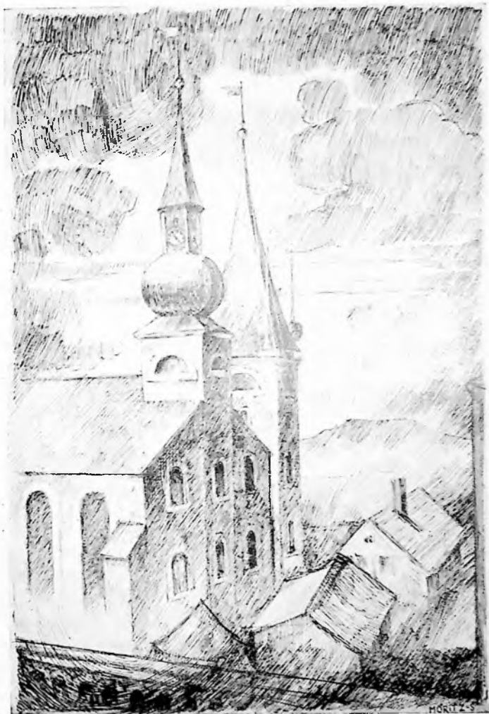
Az 1660-ban elvett templom.