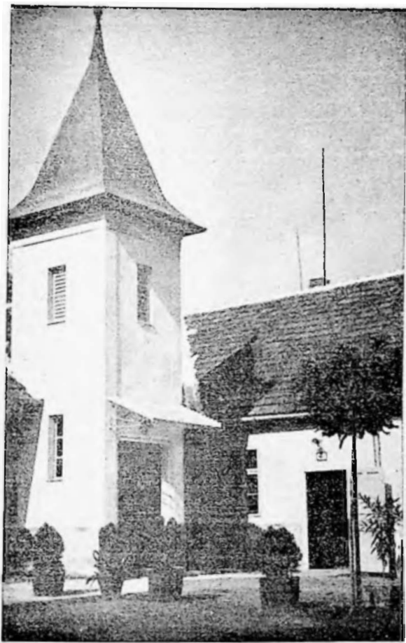
Udvaros Ferenc tb. főgondnok telkén lévő templom 1934—1942.