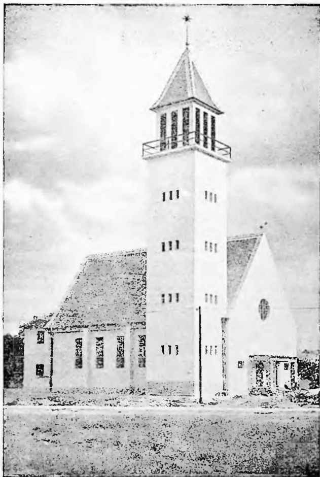
„Az Érsekújvári Református Fiókegyház HÁLAADÁS temploma“. — Épült: 1941. IX. 27 — 1942. X. 30-ig. Felszentelése 1942 XI. 8.